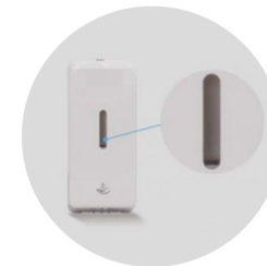
Ventanilla para observar cantidad de desinfectante disponible