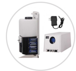
Se puede elegir funcionamiento con batería o adaptador de corriente