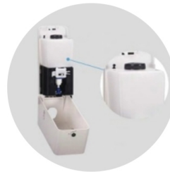
Alimentación sencilla de desinfectante